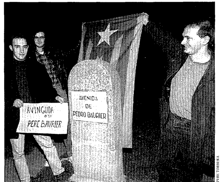
Els militants de les JERC canviant el rètol de l'avinguda de Pere Baurier

Un equip de quatre persones de les Joventuts d'Esquerra Republicana (JERC) va protagonitzar divendres al vespre una acció per catalanitzar els rètols de cinc carrers de Roda: avenida de Pedro Baurier, Juan de Mas, Pep Ventura, San Pedro i Caserras . Les JERC havien donat 15 dies de temps a l'Ajuntament de Roda per tal que catalanitzés els rètols, ja que consideren imperdonable que un ajuntament governat per un equip progressista no hagi resolt encara la catalanització dels rètols de tots els seus carrers. La campanya de les JERC també ha arribat a altres poblacions de la comarca d'Osona i a botigues que encara tenen la seva retolació en castellà. (Pàgina 6)