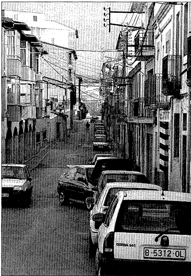
La cangur tenia llogat un pis al carrer de la Pau de Torelló

dueix a la població. L'Ajuntament no considera normal que el jutge actual només s'estigui a Ripoll un dia o dos cada setmana. (Pàgina 3)