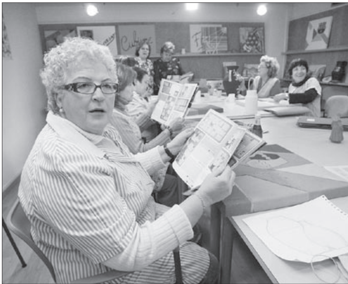
El grup de dones de la classe de pintura que es fa al Centre Comunitari també va col·laborar en el recull

de les aportacions ciutadanes. En aquest tercer número d' El diari del meu barri hi apareixen fotografies de tots els plafons de l'exposició a més de setze dels textos que conformaven aquest collage de sentiments. “No és obra de persones que saben escriure molt bé ni de grans artistes sinó de ciutadans del carrer, que han parlat d'allò que els ha alegrat o que els ha fet sentir petits”, explica Joan Oriol, regidor de Barris de Vic. Segons Oriol, “l'exposició i la revista són el clar exemple d'un treball de formigueta, que permet crear bon veïnatge”.